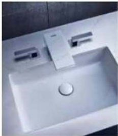
Mit dem Axor Signature Service kann man seine Armatur mitgestalten.

Schiltach. Im Zeitalter höchster Individualisierung geht auch der Armaturenhersteller Hansgrohe neue Wege. Unter der Marke Axor entstand gemeinsam mit Phoenix Design die Kollektion Axor MyEdition, eine geradlinige, monolithische Armaturenserie, die aus Korpus und Platte besteht und über 225 Designvarianten anbietet.