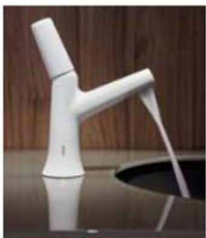
Die Armaturenserie Vita von Cical zeigt sich poppig und dennoch exklusiv.

Alzo di Pella, Piemonte. Schon der erste Blick lässt erahnen, aus welcher Feder die außergewöhnliche Armatur stammt. Es ist Karim Rashid, der – berühmt für seine organischen Formen – sich bei dieser Kreation an der Silhouette eines Zweiges oder Bambusrohres orientiert. „Ein Bad muss mehr bieten als nur Funktion. Es geht um Sinnlichkeit und ästhetischen Genuss“, ist er überzeugt.