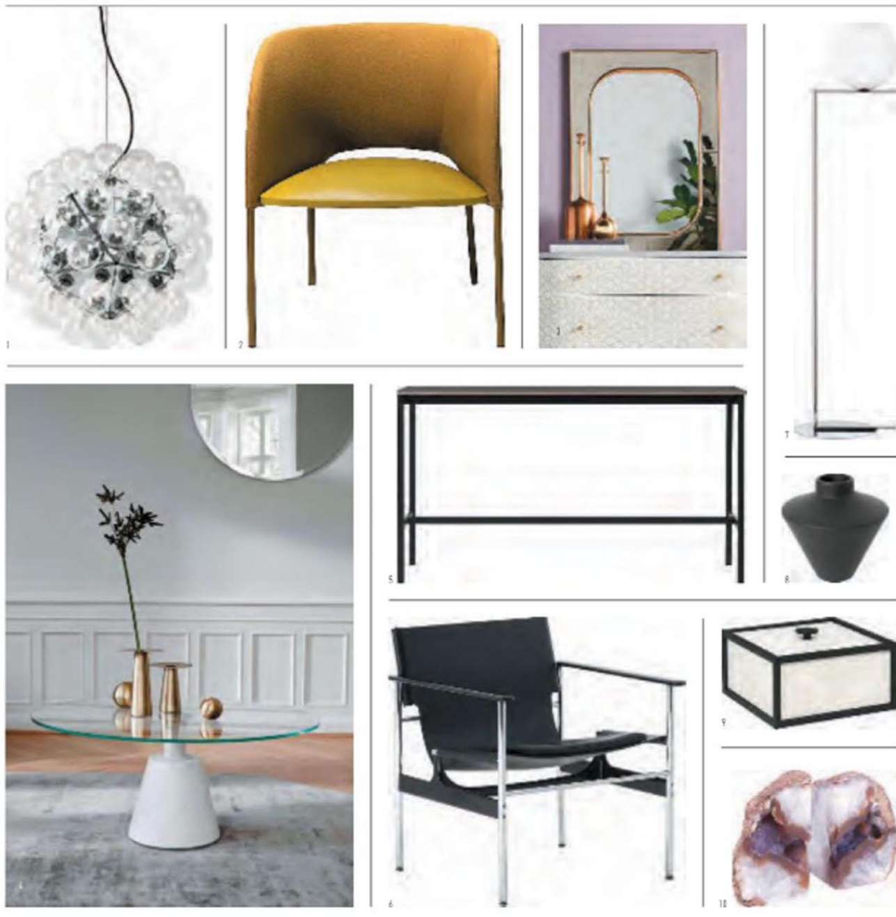
1. Lámpara de techo 'Taraxacum' de Flos / 2. Silla 'Yumi' de Bendtsen Design Associates para Moroso / 3. Espejo 'Roten' de Anthropologie / 4. Mesa 'Madrid' de BoConcept / 5. Consola 'Base' de Muuto / 6. Silla 'Pollack' de Knoll / 7. Lámpara de piso 'IC' de Flos / 8. Jarrón de H&M Home / 9. Caja de By Lassen / 10. Sujetadores libros 'Natural Agate' de Jonathan Adler