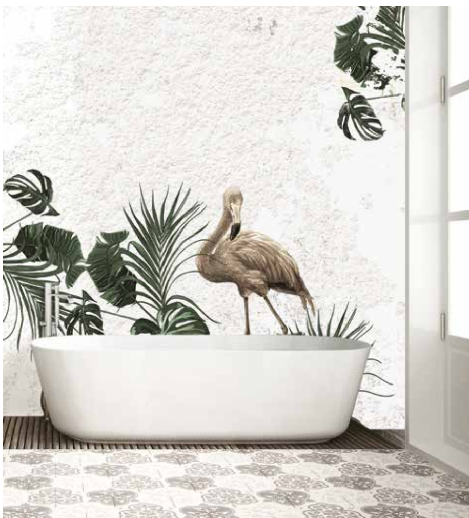
Bird Garden kallar Instabilelab detta mönster med växter och fåglar. De skapar vattentäta tapeter i Fibra Glass eller Fibra Tex för badrum. Tapeten flyttar in naturen i badrummet. Här är också känslan av mur tydlig.

→ mosaikbitarna skapar en textil känsla. Kanske kan Pinstripe kombineras med andra kollektioner, till exempel i vitt. Instabilelab skapar ständigt nya tapeter för våtrum. Med slingrande växter och fåglar kan man föra in naturen i badrummet. Det finns också många andra motiv att välja mellan. I Devon & Devons nya kollektion porslinsplattor finns Decor, ett stiliserat mönster med akantusblad. Designern är Paola Tanini som är art director på företaget. Det dekorativa mönstret är digitaltryckt och finns i sex färger. Devon & Devons tapet Botanica tar för sig, tänkt för lyxigt boende i hem eller hotellmiljö. Formgivaren Vito Nesta har fångat naturen på ett sätt som ger begär. I det stiliga badkaret Hollywood kan jag lätt tänka mig att drömma mig bort i tapetens mångfald. ♦