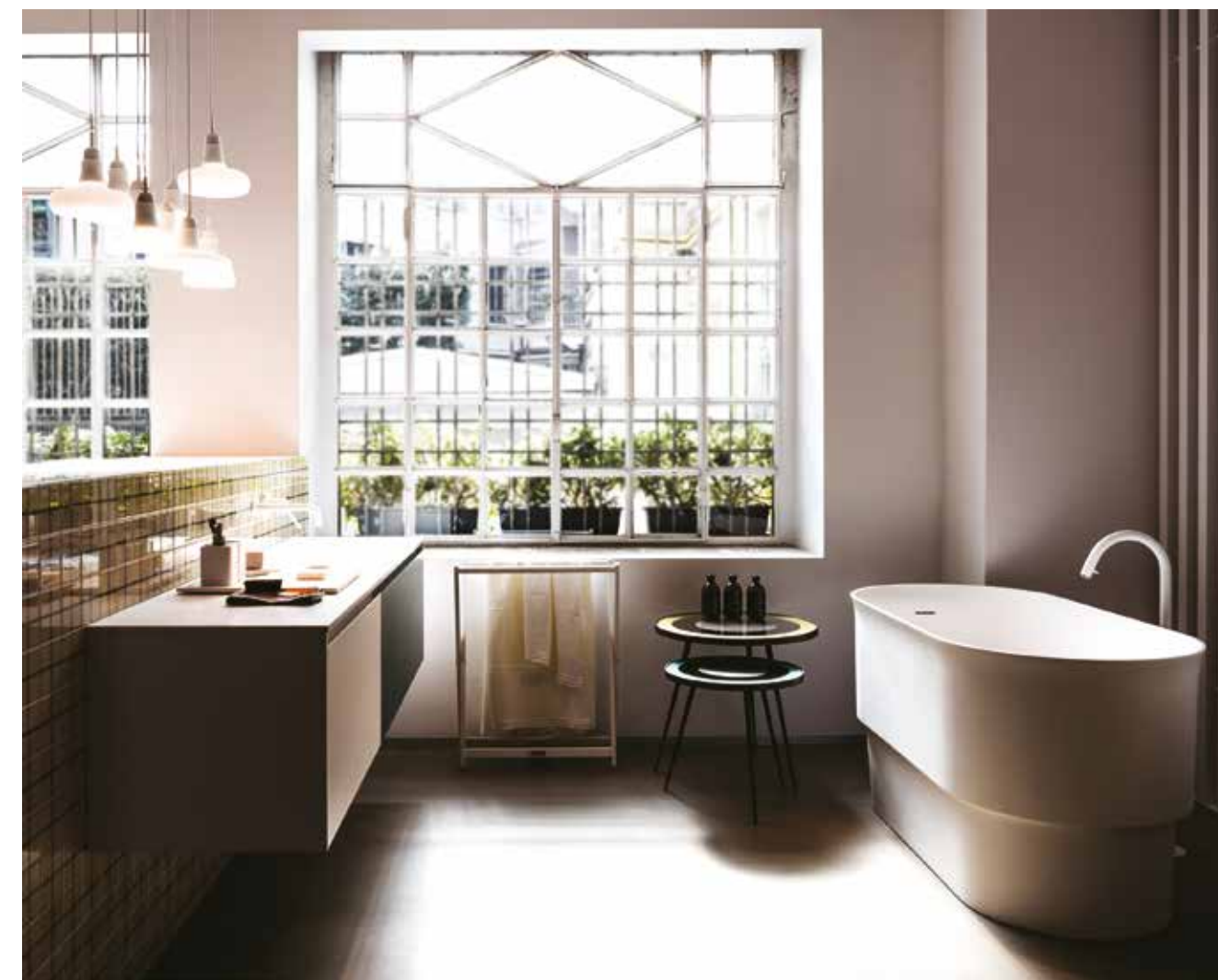
Neri & Hu har skapat Agapes nya stilrena kollektion Immersion. Det skulpturala karet i biobaserad Cristalplant passar i många miljöer. Karet är praktiskt med extra djup och kräver mindre golvyta, något som designerna anser nödvändigt med allt tätare städer världen över.