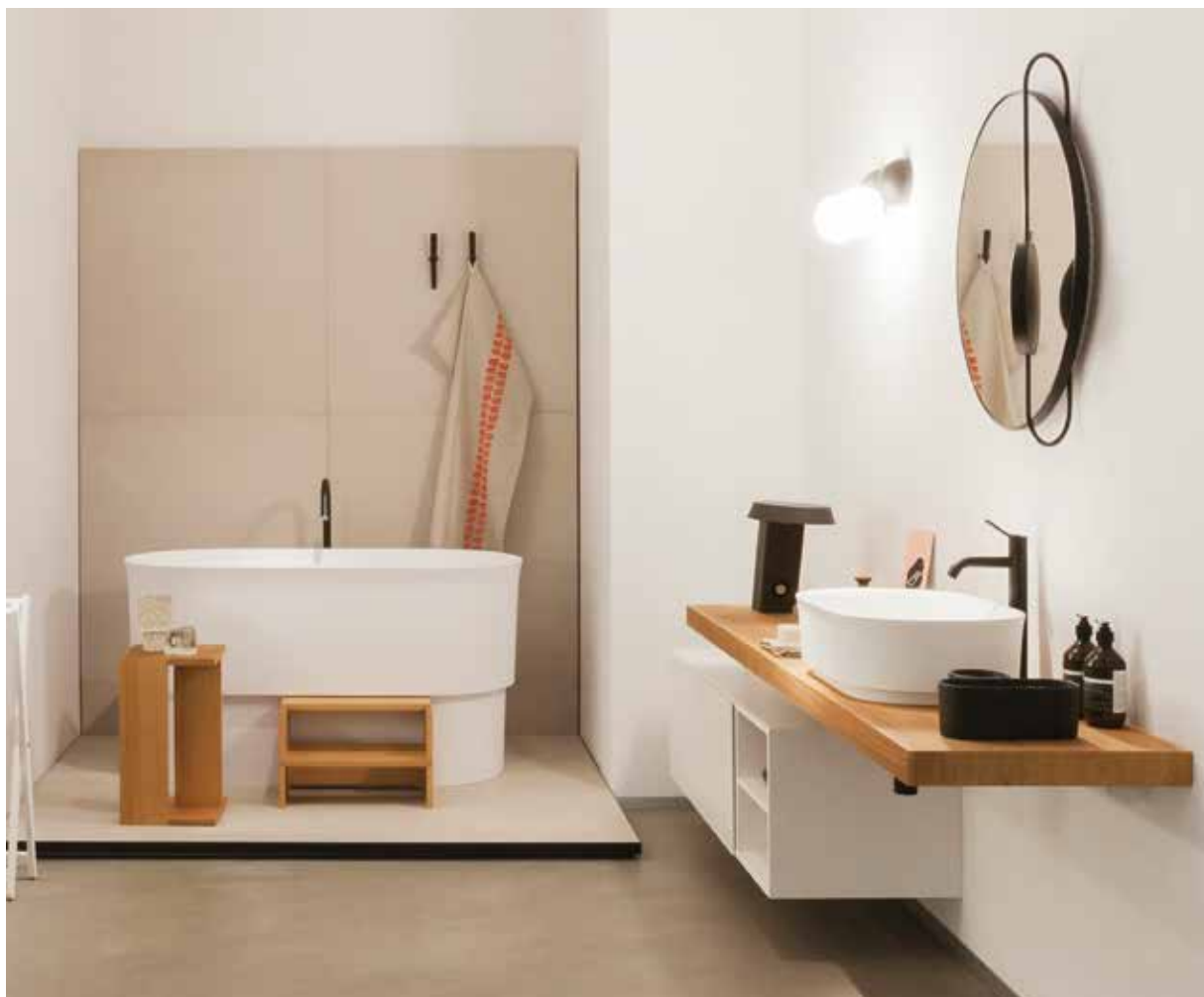
Agapes nya minimalistiska kollektion Immersion, designat av Neri & Hu, är inspirerad av traditionella träbadkar i Japan och Kina. Kar och även handfat är extra djupa med en mindre fot. I karet finns en sits i iroko som går igen i den praktiska bänken, som stående blir ett litet bord.