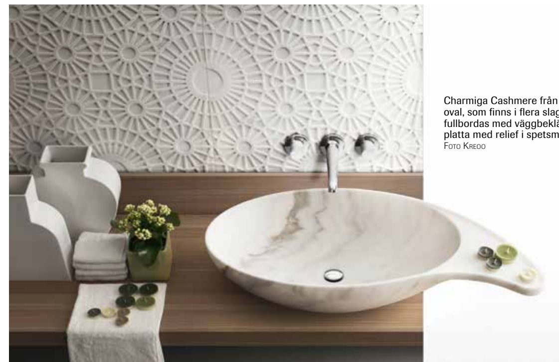
Charmiga Cashmere från Kreoo är en asymmetrisk, sammetslen oval, som finns i flera slags marmor. Designer är Enzo Berti. Lyxen fullbordas med väggbeklädnaden Merletto, en handgjord marmor- platta med relief i spetsmönster, också den skapad av Berti.