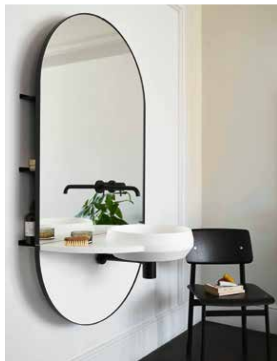
Ex.ts dekorativa spegel med ett integrerat hyllsystem bakom glaset heter Arco och finns också i mässing. Designer är spanska MUT.

Franska India Mahdavi är formgivaren bakom Bisazzas nya kollektion med namnet Mahdavi. Kollektionen finns i tre starka, lite "smutsiga" pasteller, nämligen jordgubb, blåbär och pistage. Bakom syns emaljmosai- ken Pinstripe med en textil känsla. →