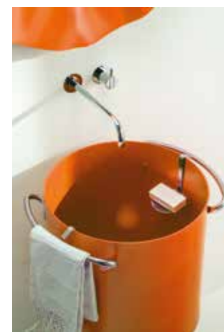
Marco Merendi har designat Chef från Rapsel. Serien finns i grått och orange, i aluminium. Spegeln med veckad ram ger en poetisk aura medan handfat och tvättkorg är mer lekfulla.