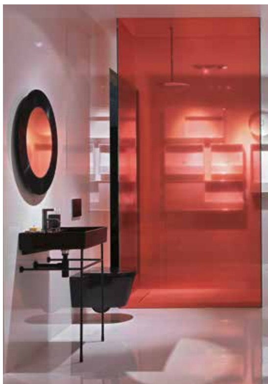
En bild från Kartell by Laufens monter på vårens II Salone visar en raffinerad dynamik med svarta sanitetsartiklar och en röd duschvägg. Designerna Ludovica och Roberto Palomba har skapat kollektionen med samma namn.