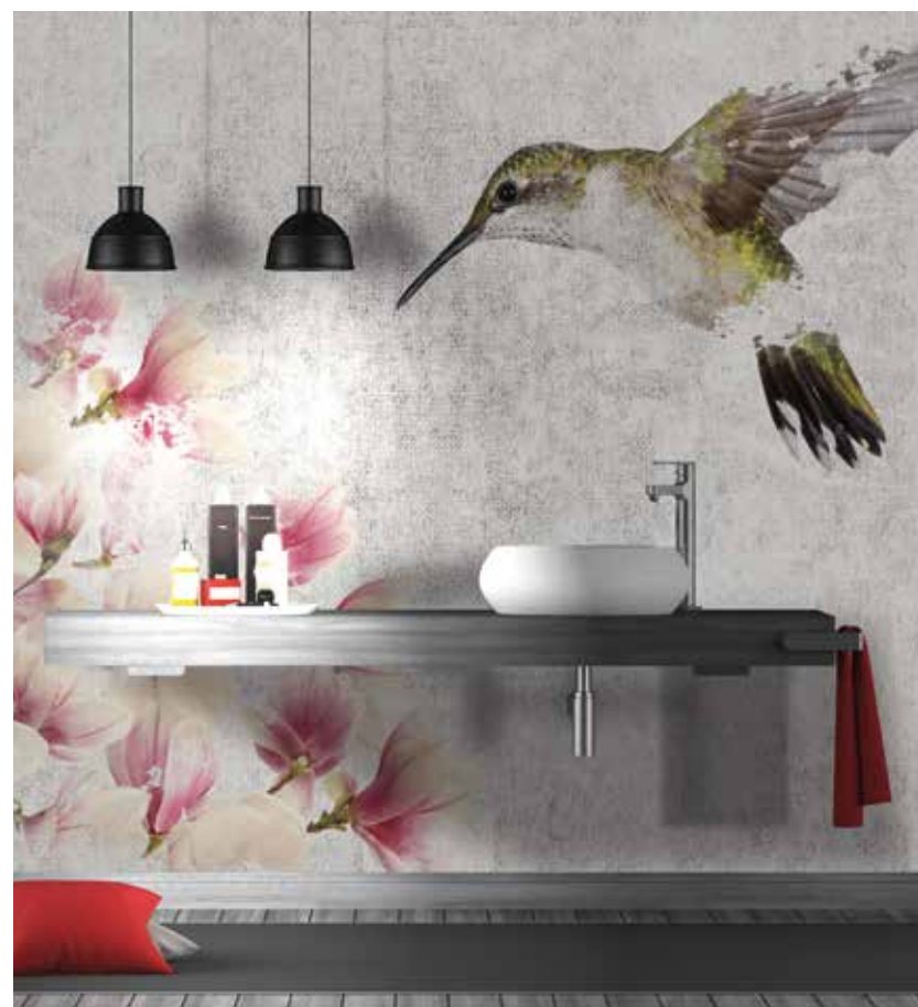
Mariane är en romantisk vattentät tapet för badrum från Instabilelab. Man fokuserar gärna på blommor, växter och vackra fåglar. Med tapeter kan du skapa en personlig miljö.