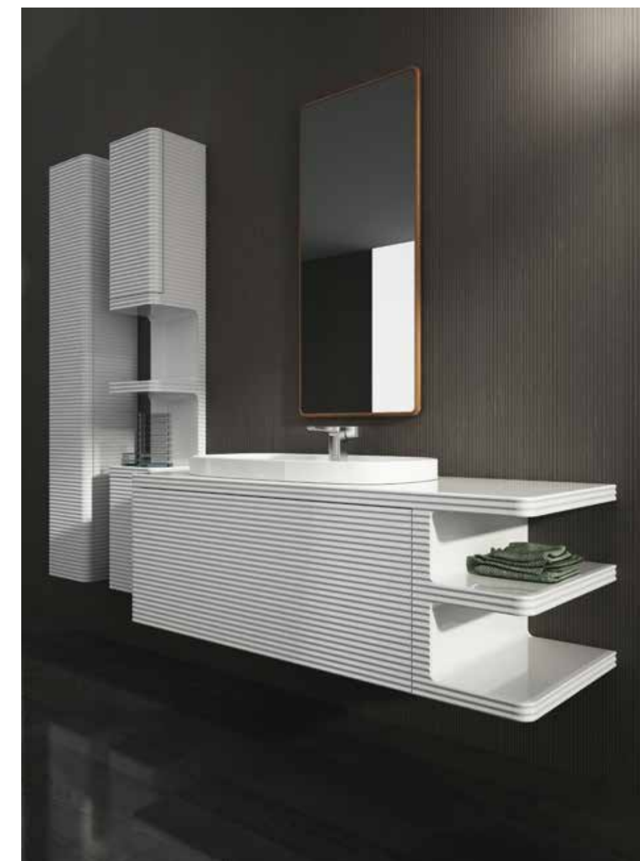
I kollektionen Ub från Antonio Bullo Workshop är det horisontella linjer. Det är mycket karaktär, här i en ultravitt lackad version. Ub finns också i valnöt med vita hyllplan och serien omfattar även sanitetsartiklar. Det är solitt trä och i öppna hyllor Corian. FOTO ANTONIO BULLO WORKSHOP