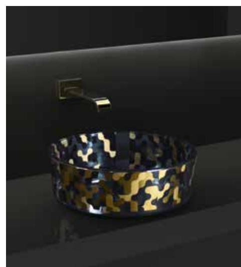
Raffinerat är handfatet Marea, designad av välkände Karim Rashid för Glass Design. Det är kristall med en digitaliserad gulddekor i serigrافي. Unika Marea finns också i en rödskimrande variant. Något att lyxa till det med?