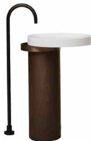
Nya Eccentrico från Falper är en fristående totemliknande skapelse designad av Victor Vasilev. Det cirkelrunda handfatet i Cristalplant är asymmetriskt placerat och blandaren i metall står fritt bredvid pelaren i trä.