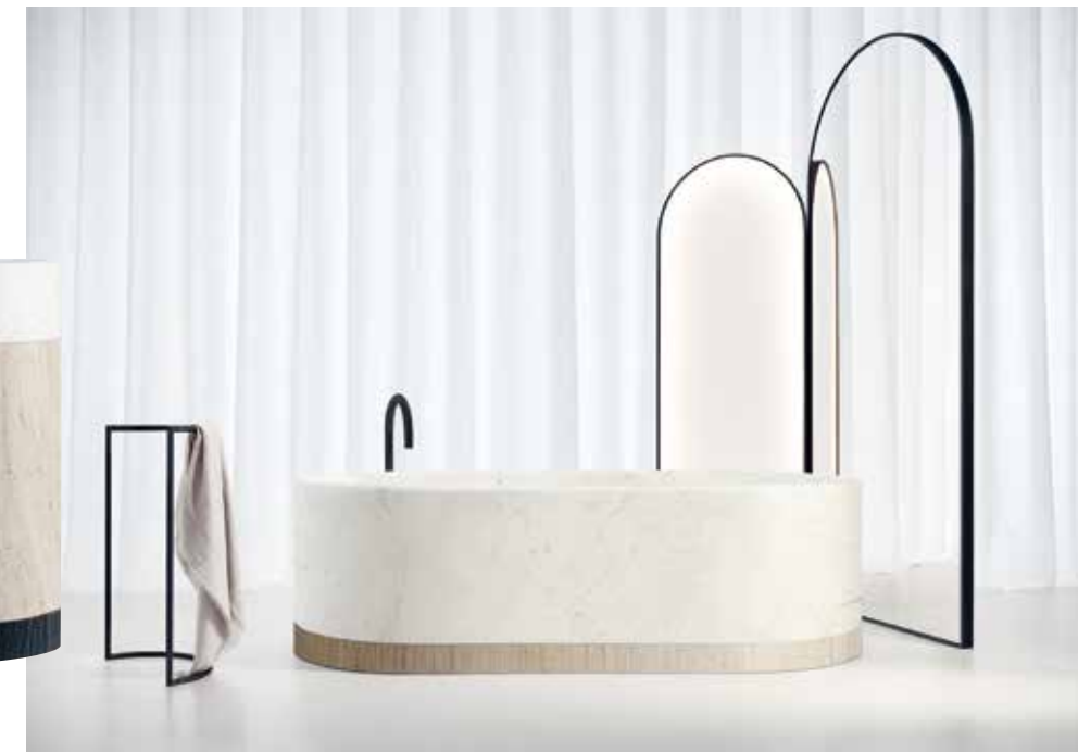
I Milldues serie Noorth ingår kollektionen Roma, designad av Lievore Altherr. Roma kombinerar trä och sten som i den klassiska arkitekturen vid Medelhavet. Det är symmetri och rena linjer. Handfatet är en fristående cylinder och badkaret en stor monolit. I Roma ingår också handdukhängare och rundbågade spegelskärmar.