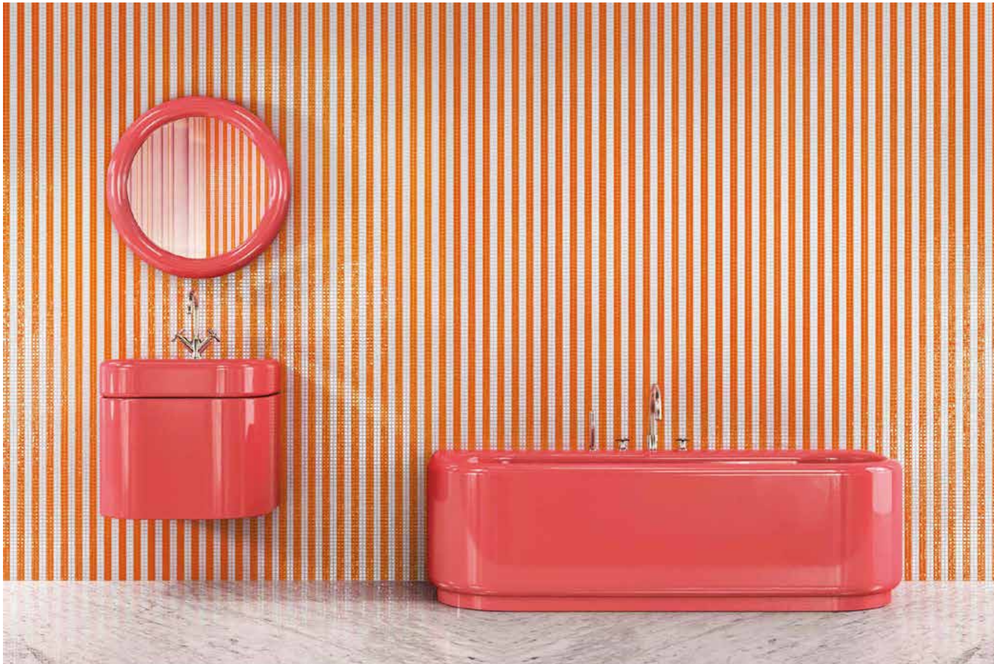
India Mahdavi har skapat Bisazza Bagnos nya kollektion Mahdavi, en lekfull kollektion i tre starka pastellfärger. Här är det Strawberry. I karet är det lackat fiberglas, i kommoden och spegeln lackat trä och i handfatet glaserad keramik. Till de rena, lite bulliga formerna har India Mahdavi och Bisazza skapat emaljmosaikerna Pinstripe i den venetianska kollektionen Opus Romano. Pinstripes textila känsla är tydlig.